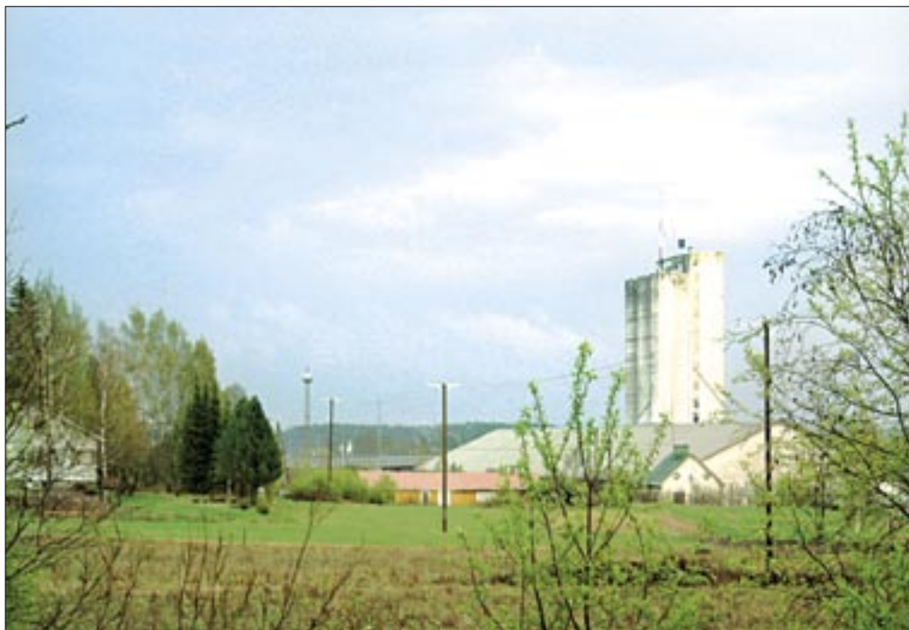
Kylän maisemaa hallitsee massiivinen viljasiilo

On sanottu, että kylämme on liian kaukana Lappeenrannan keskustasta, ”pussissa”. Onneksemme julkisen liikenteen vuorot ovat hyvät. Teiden kapeus ja niiden vähäinen kunnossapito aiheuttavat kyläläisille ja täällä työssä käyville huolta ja jopa turvattomuuden tunnetta.