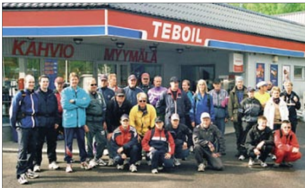
Kylähullun kävelyn suosio on kovassa nousussa.