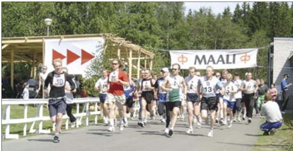
Vuonna 2004 hölkkätapahtuma järjestettiin osana Vainikkala-päivää.