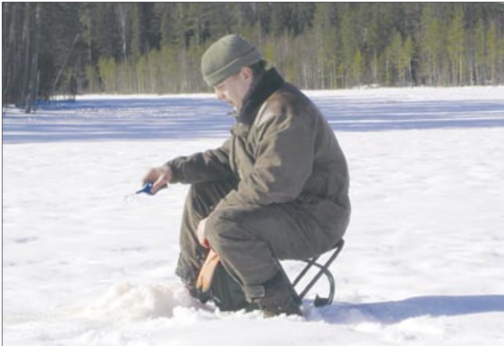
Vainikkalan järvet ja lammet tarjoavat puitteet monipuoliseen kalastusharrastukseen.

Vainikkalan vesillä järjestetään yleensä kolmet avoimet pilkkikilpailut talvella sekä yksi avoin ongintakilpailu kesällä.