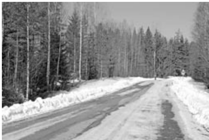
Uusi tieosuus erkanee nykyisestä tiestä entisen Ojalan tiilitehtaan kohdalta. (Sauli Vainikka)

Urakkaan sisältyvän Simola – Ojala -tieosuuden kokonaispituus on noin yhdeksän kilometriä. Tiestä rakennetaan päällystetty 7,5 metrin levyinen ja sen mitoitusnopeudeksi on määritelty 80 km/h, poikkeuksena Simolan ja Rikkilän kyläalueet joissa nopeudeksi rajoitetaan 40-60 km/h.